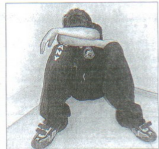
Haben Kinder Angst, strahlen sie dies nach außen aus.

Daraus schöpft er Kraft. Früher wie heute. „Ich habe Sechsjährige in meinen Kursen, die nicht mehr leben wollen“, erzählt Stahl von einem Selbstverteidigungstraining in seiner Heimatstadt Bopfingen. Der Sonntagabend sei für viele Kinder, die in der Schule gemobbt oder geprügelt werden, der schlimmste Tag. „Wir sollten uns alle schämen“, prangert Stahl das Verhalten mancher Erwachsener an. „Wir leben es den Kindern doch vor“. Schließlich seien Lästereien auch am Arbeitsplatz oftmals an der Tagesordnung. Warum? „Jeder Mensch, der Gewalt und Mobbing ausübt, will Liebe erfah-